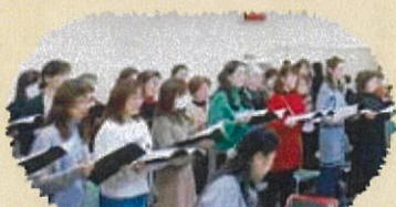
合唱 やなせたかしを歌う 混声合唱団