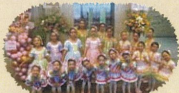
バレエ Releve Classical Ballet Kumamoto