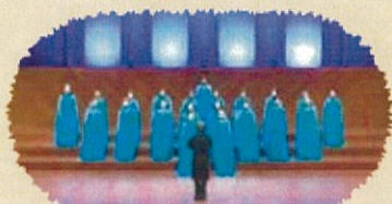
合唱 コールいずみ