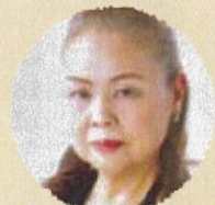
総合プロデュース 春日信子