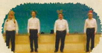
男声カルテット メグめぐ4