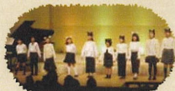
合唱 けんぶん少年少女合唱団